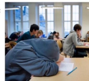
Enligt skollagen ska utbildningen vila på vetenskaplig grund och beprövad erfarenhet. Det finns både i forskningen för att fysisk aktivitet bidrar till barns utveckling, hälsa och lärande. Det är dags att utbildningsminister Gustav Fridolin (MP) lyssnar på detta, skriver debattörerna.