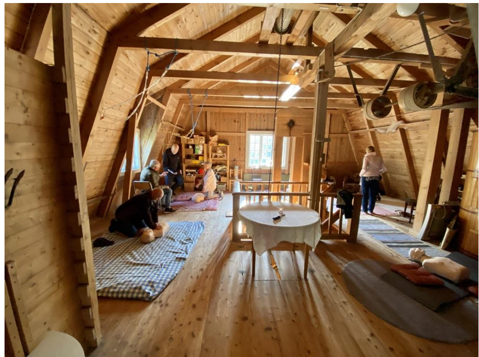
HLR-träning för grannar