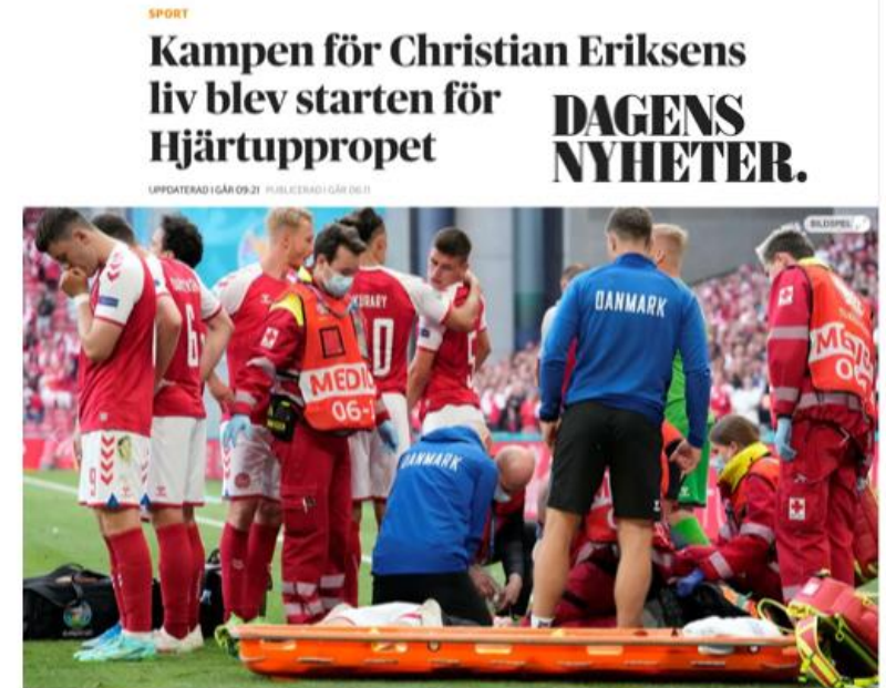
Bild 1 av 2 Oron hos publik, spelare och ledare var stor efter att Christian Eriksen segrade ner under Danmarks EM-match mot Finland på Parken i Köpenhamn