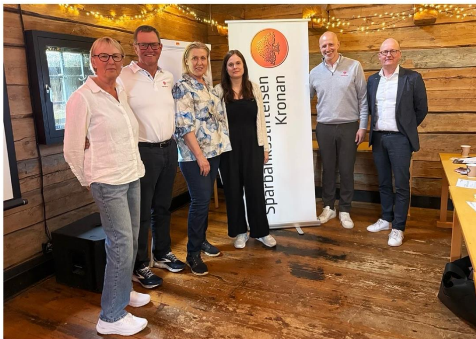
Sparbankstiftelsen Kronan och Hjärtuppropet

Sparbankstiftelsen Kronan satsar på hjärtsäkerhet – tillsammans med Hjärtuppropet https://sparbanksstiftelsenkronan.se/hjartuppropet