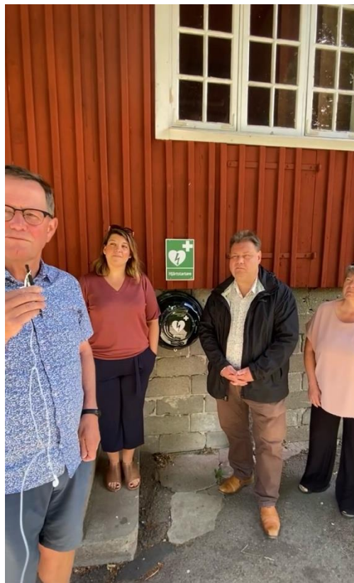
Samtal med kommunalråd och regionråd