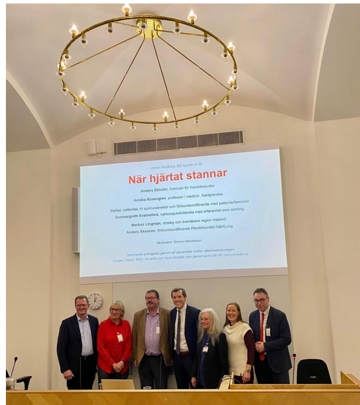
Seminarium i Sveriges Riksdag